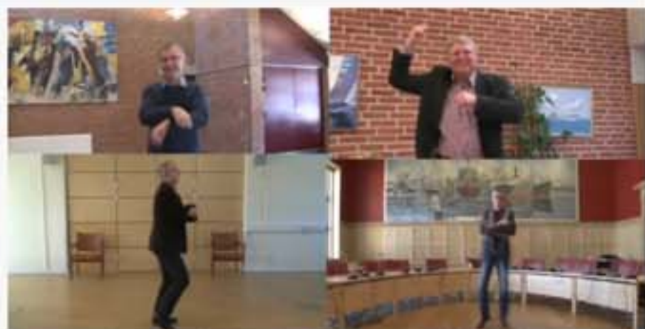
Borgmestre fra Sydfyn danser Sydfyn Style for at tiltrække iværksættere.

Tags: Borgmestre , Gangnam-style , Iværksættere , politik , Sydfyn