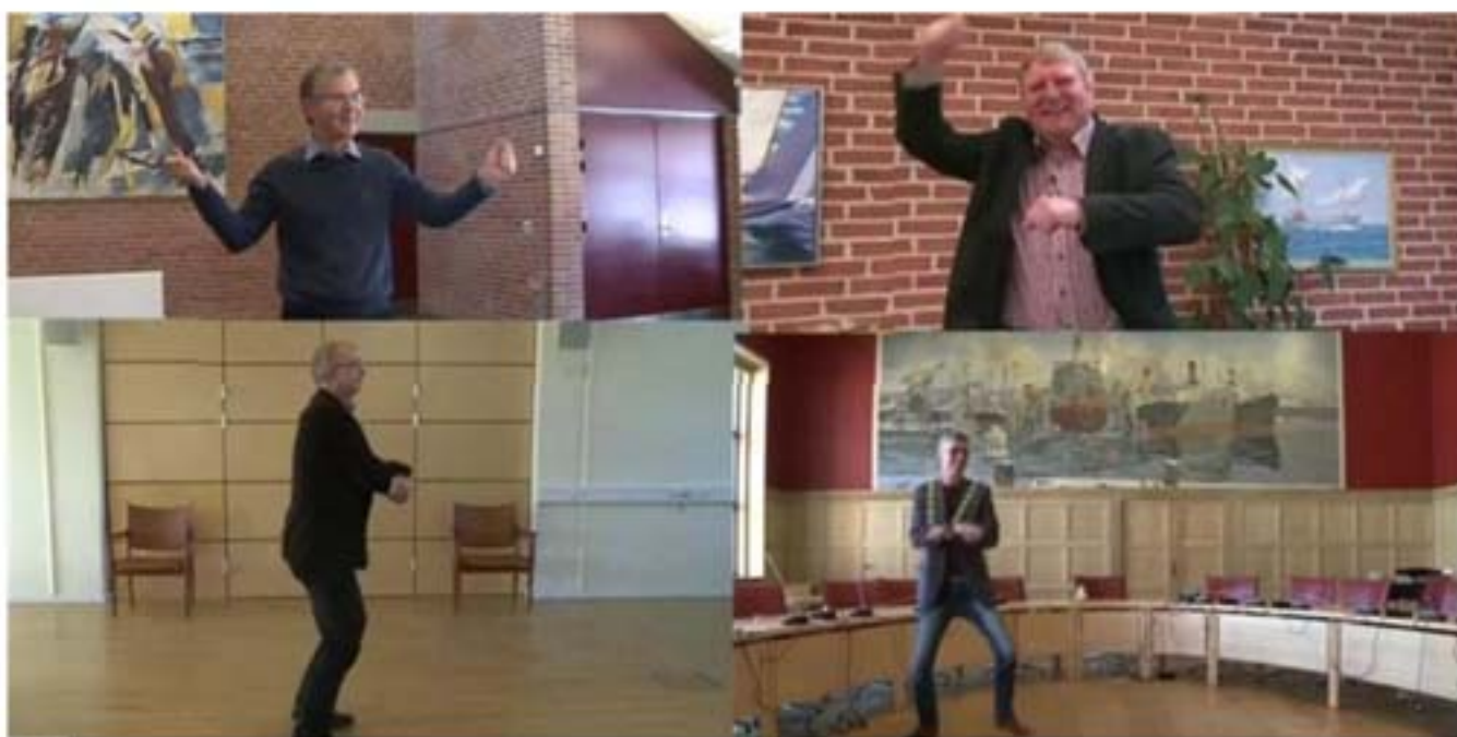
I "Sydfyn Style" synger fire sydfynske borgmestre en tekst om Sydfyn på melodien til megahittet "Gangnam Style".

13. maj 2013 kl. 12:56 • Leveret af Nyhedsbureauet Newspaq